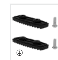
Photo n° de commande 19220, utilisation uniquement en liaison avec patin intérieur nivello® N° de commande 19215-19218