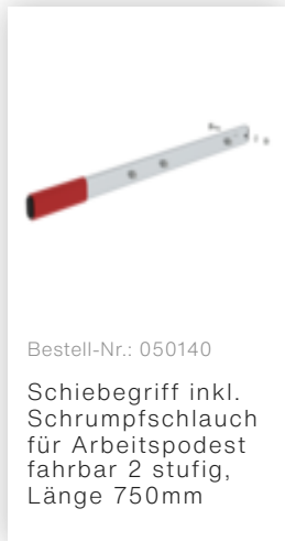
Bestell-Nr.: 050140 Schiebegriff inkl. Schrumpfschlauch für Arbeitspodest fahrbar 2 stufig, Länge 750mm