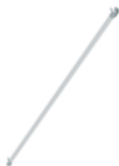
Planche de bordure latérale pour longueur d'échafaudage 2,45 m