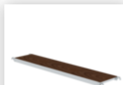
Plate-forme avec trappe pour longueur d'échafaudage 3,0 m