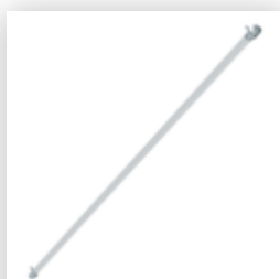
Planche de bordure latérale pour longueur d'échafaudage 3,0 m