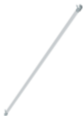
Planche de bordure latérale pour longueur d'échafaudage 2,45 m