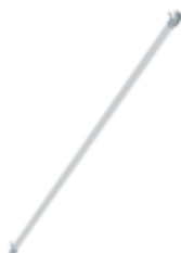
Planche de bordure latérale pour longueur d'échafaudage 2,45 m