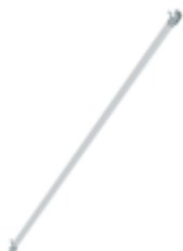
Planche de bordure latérale pour longueur d'échafaudage 2,45 m