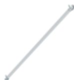
Planche de bordure latérale pour longueur d'échafaudage 1,8 m