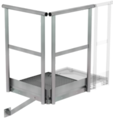
Plate-forme de base 800 x 800 mm