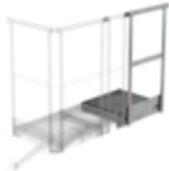
Plate-forme d'extension 400 x 800 mm