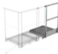
Plate-forme d'extension 500 x 1000 mm