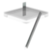
Plate-forme d'extension 1000 x 1000 mm