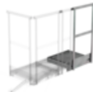
N° de commande: 060943 Plate-forme d'extension 800 x 800 mm