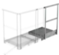
N° de commande: 060951 Plate-forme d'extension 1000 x 1000 mm