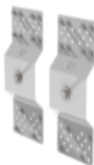
N° de commande: 063278 Support mural