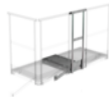
N° de commande: 060952 Plate-forme d'extension 500 x 1000 mm