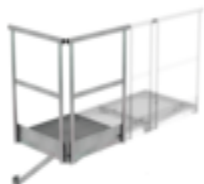
N° de commande: 060950 Plate-forme de base 1 000 x 1 000 mm