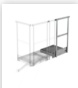
Plate-forme d'extension 400 x 800 mm