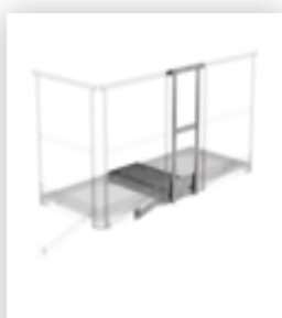
Plate-forme d'extension 1000 x 1000 mm