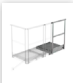
Plate-forme d'extension 800 x 800 mm