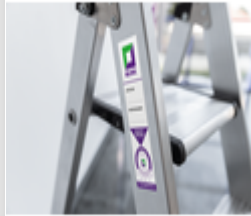
Plate-forme de base 1 000 x 1 000 mm