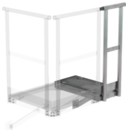
Plate-forme d'extension 400 x 800 mm