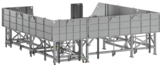
Plate-forme de travail avec garde-corps à réglage électrique, partiellement mobile