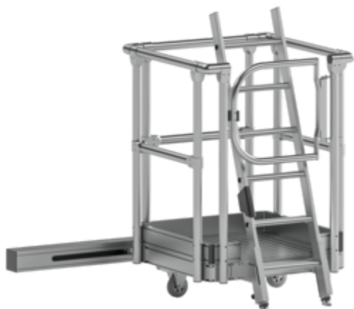
Plate-forme avec échelle à marches