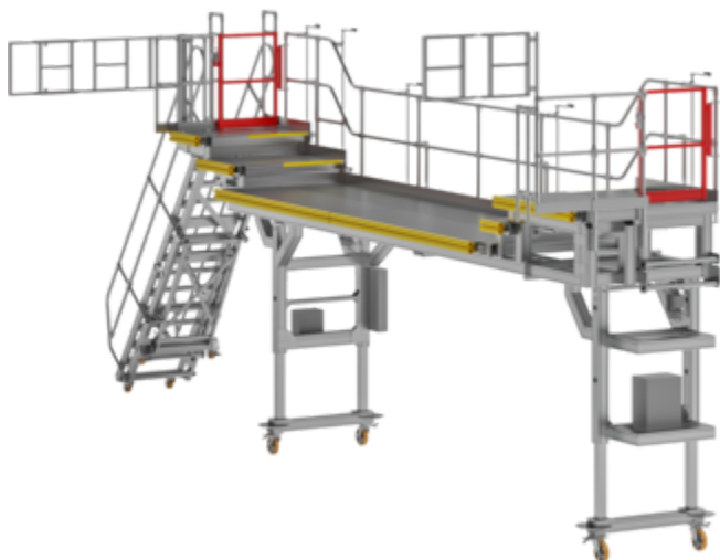
Plate-forme de dock adaptée aux contours